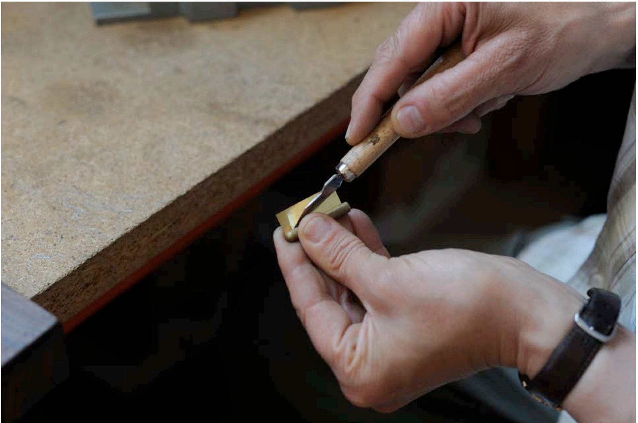
CONFECTION LANGUETTE #2