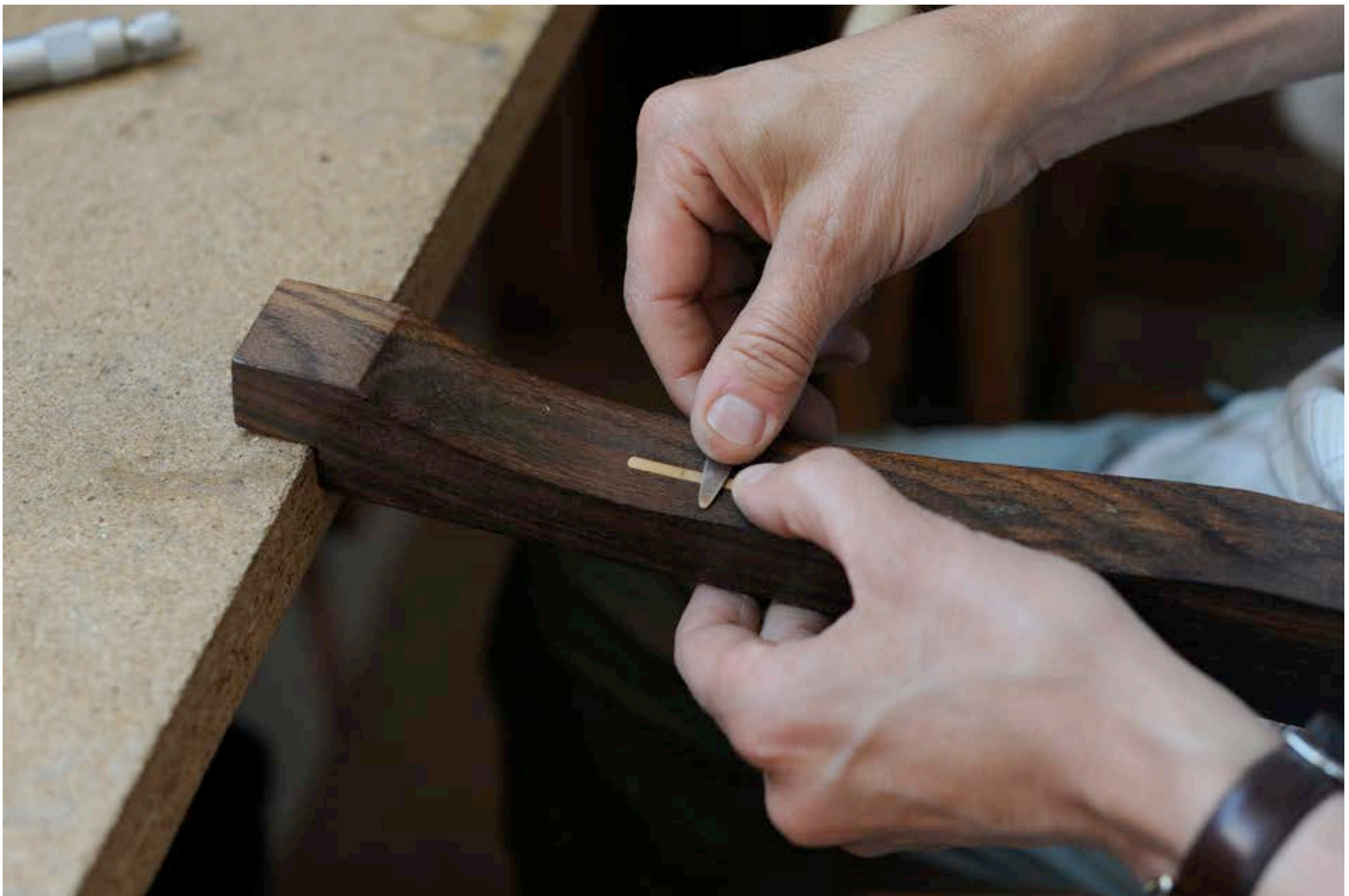
RÉALISATION DE LA COURBURE SUR BOIS À COURBER