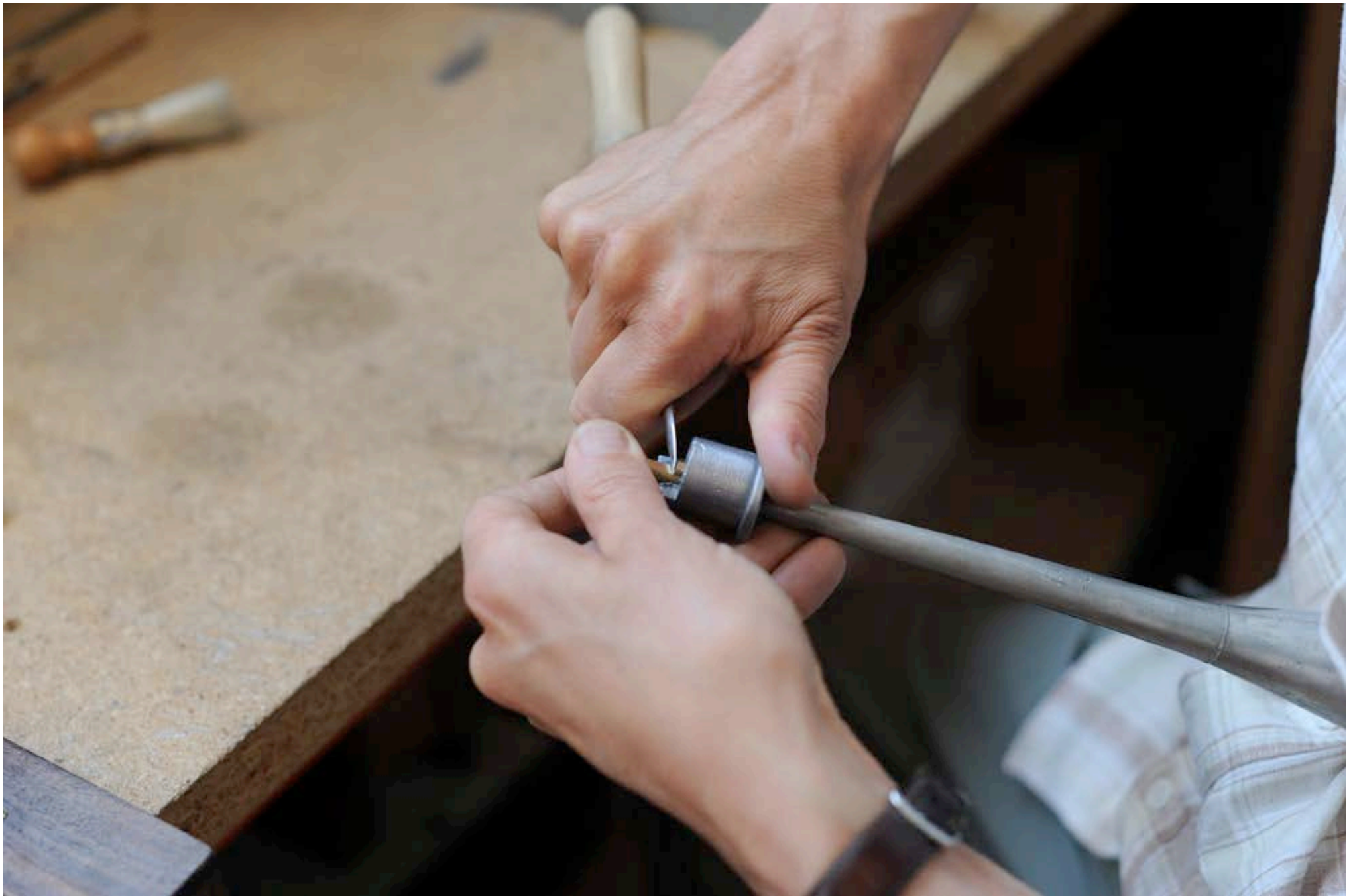
REMONTAGE DE LA LANGUETTE