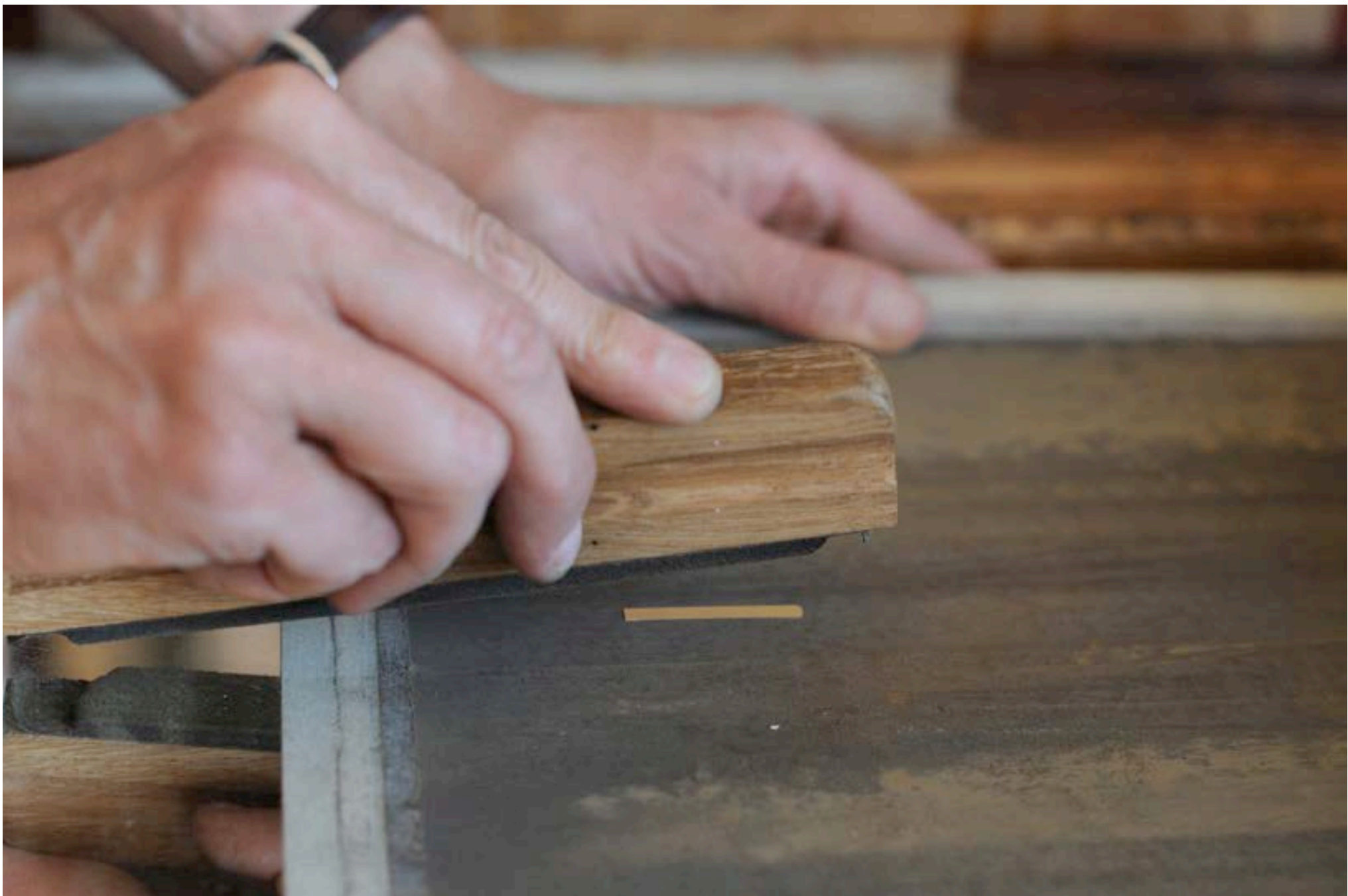
MORFILAGE ET DRESSAGE DE LA LANGUETTE