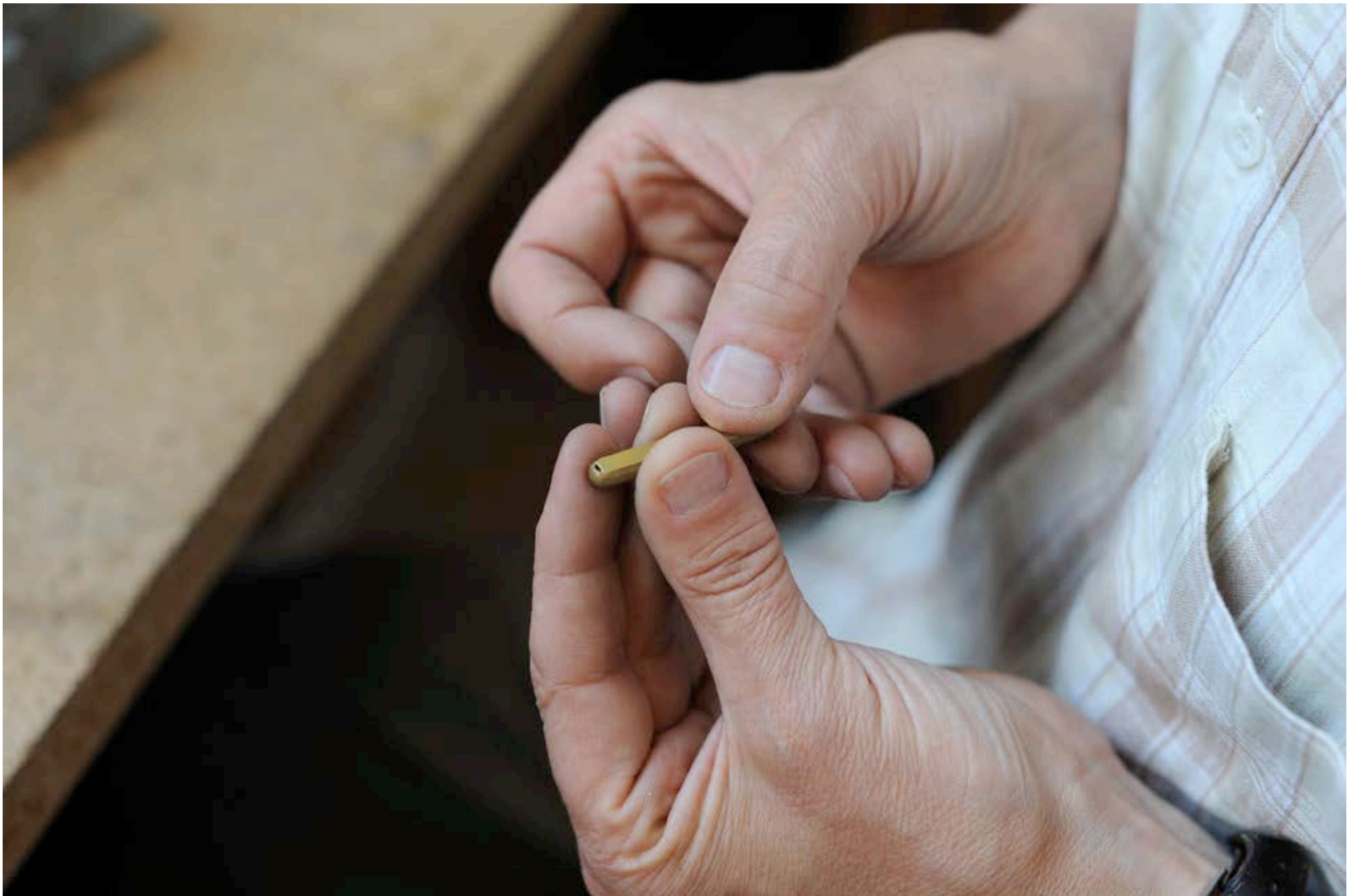
CONFECTION LANGUETTE #4