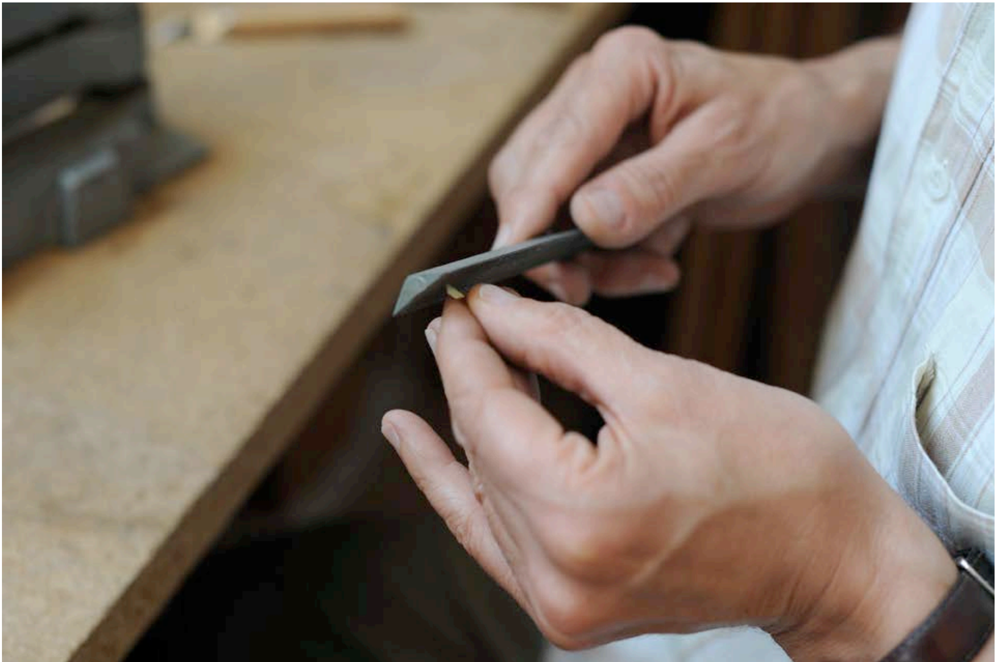
CONFECTION LANGUETTE #3