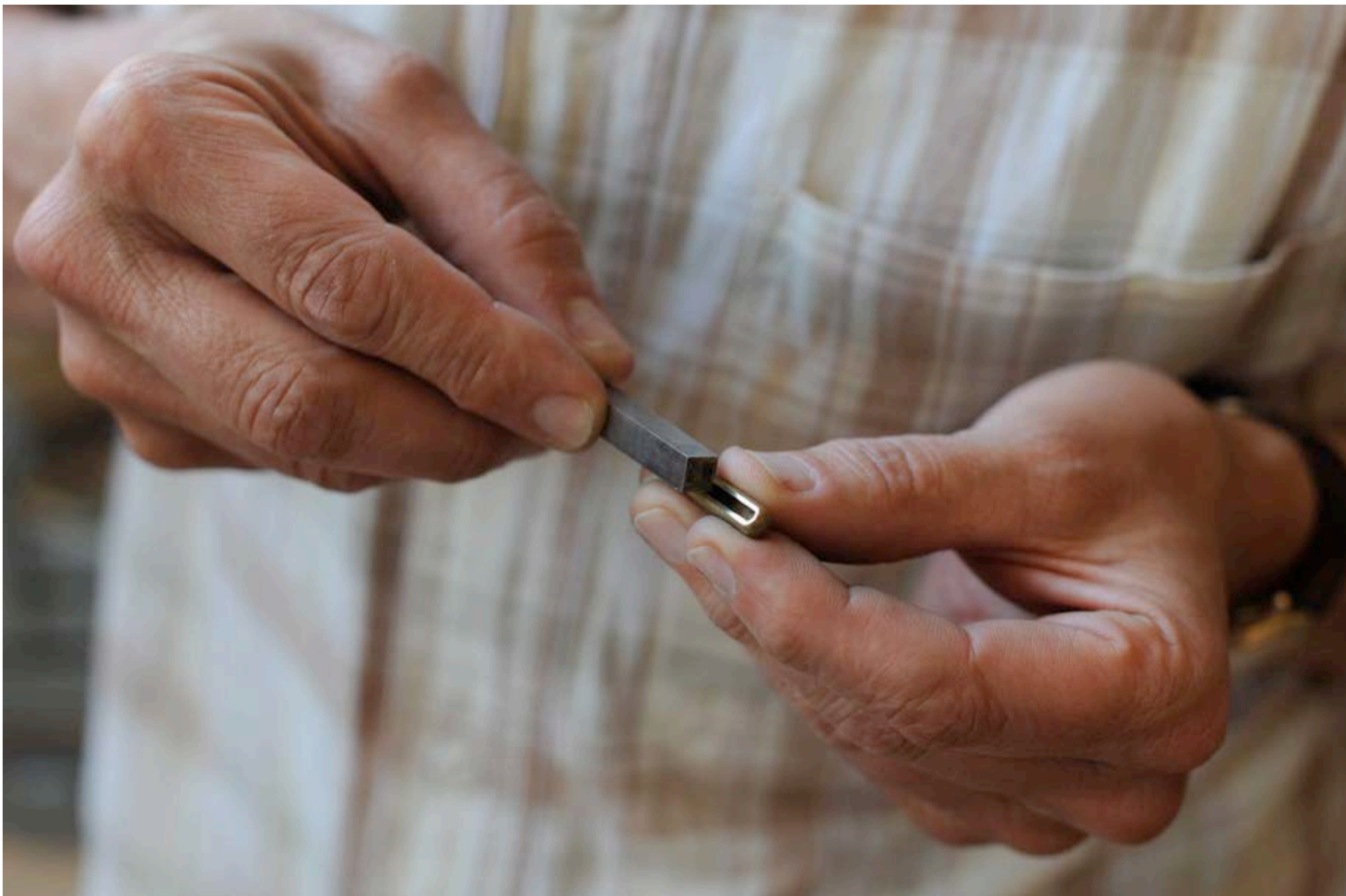
ADOUCCISSEMENT DES ARÊTES