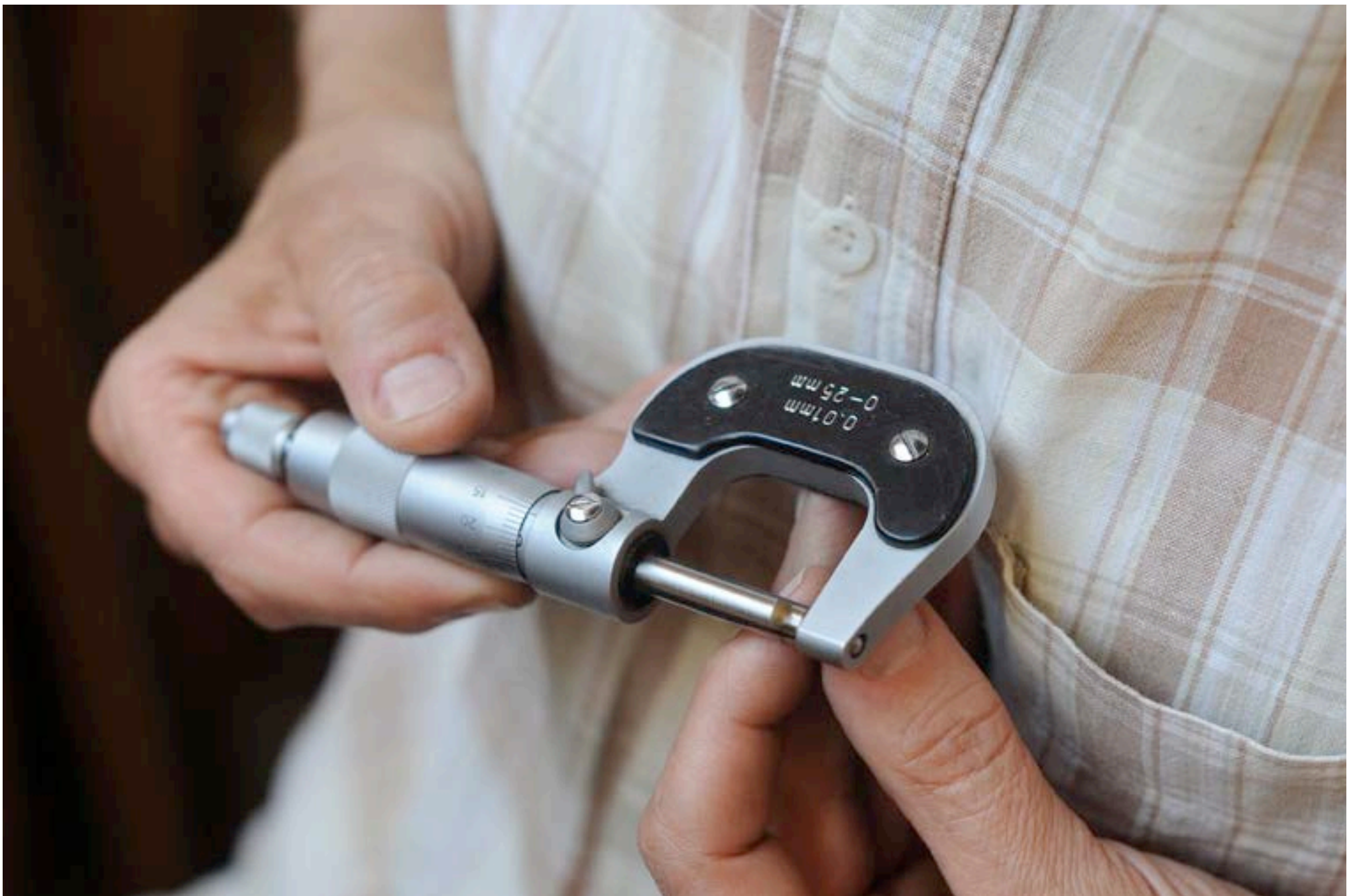
MESURE ÉPAISSEUR DE LA LANGUETTE