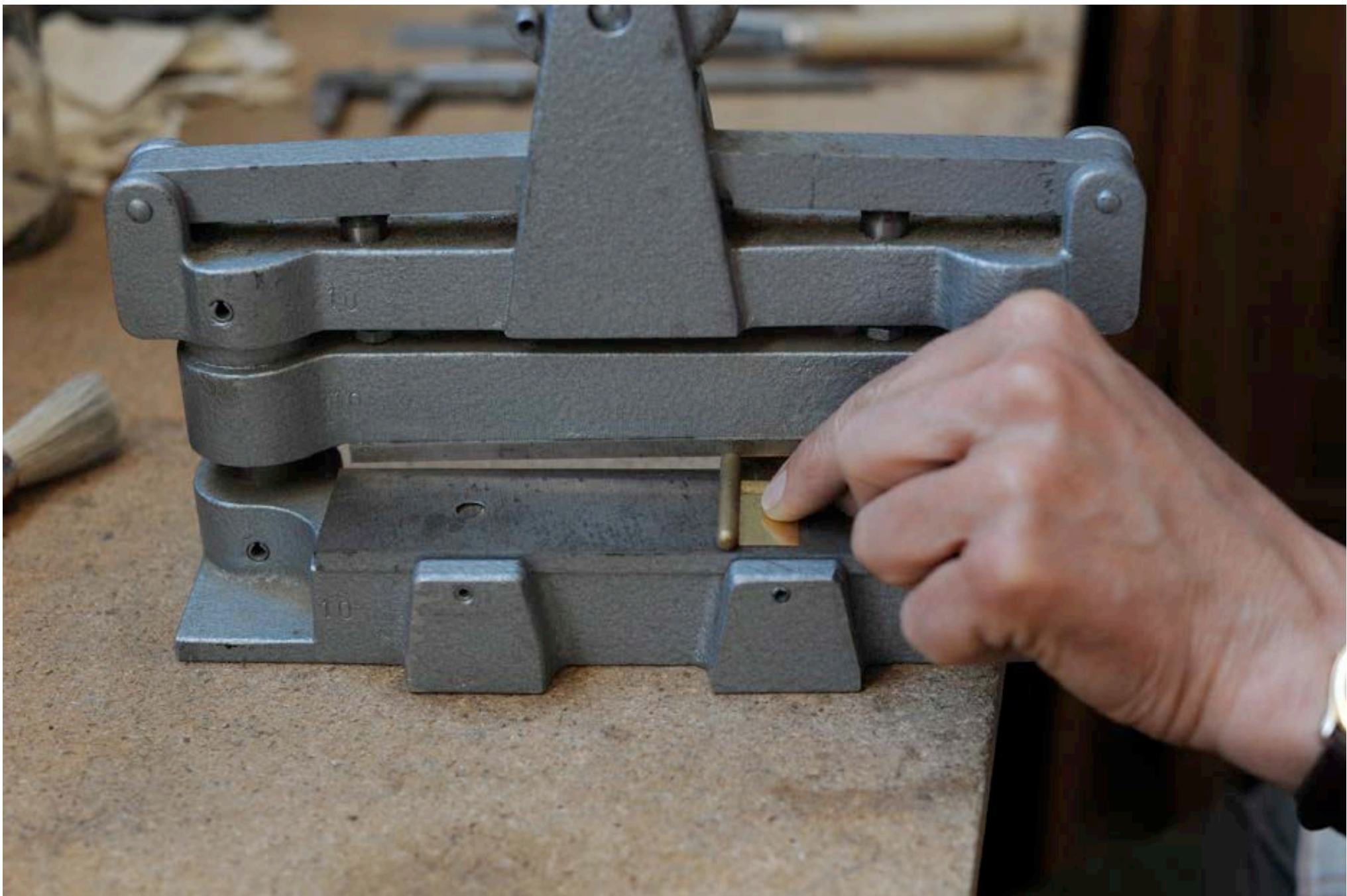
CONFECTION LANGUETTE #1