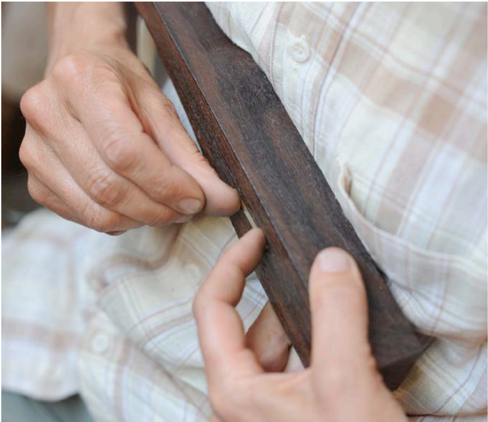
CONTRÔLE DE LA COURBURE